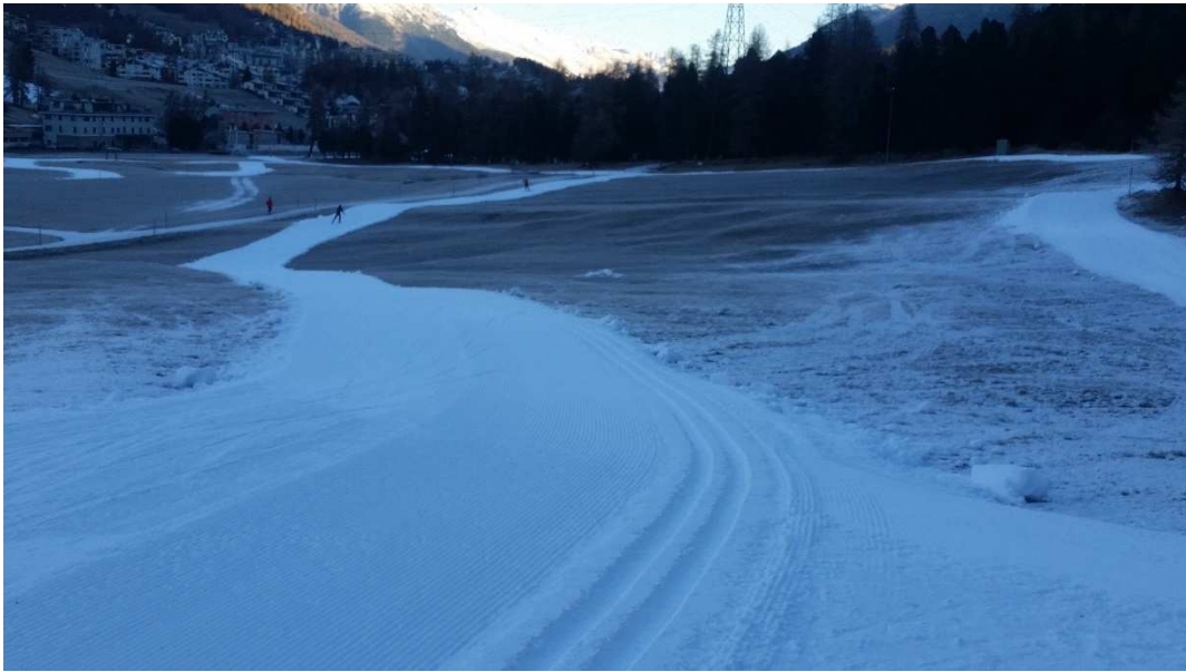
Kunstschneeloipe in St. Moritz