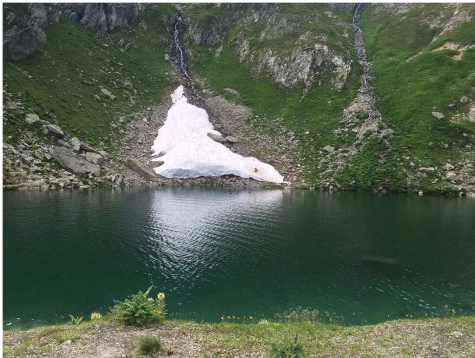
auch dieser Bergsee gab uns eine nette Abkühlung :-)